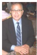
Presidente da ABRPT

"Juntos somos mais fortes do que em separados"