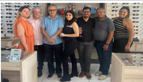
Em comemoração aos 20 anos da Ótica Popular. Não compre sem nos consultar. Rua Visconde de Inhaúma, 89, Centro, Ribeirão Preto.